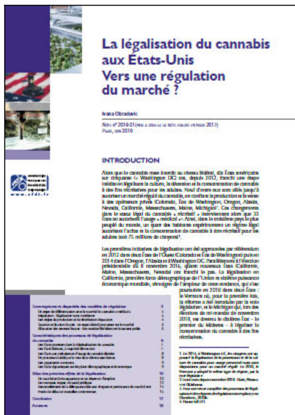
Note 2019-01, OFDT, 25 p. Juin 2019

Alors que le cannabis reste interdit au niveau fédéral, dix États américains sur 50, ainsi que Wahington DC, ont, depuis 2012, légalisé la culture, la vente, la détention et la consommation de cette substance à des fins récréatives à partir de 21 ans.