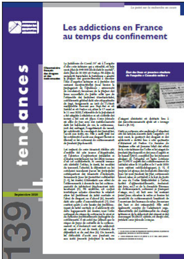
Tendances n° 139, OFDT, 8 p. Septembre 2020

La pandémie de Covid-19 est à l'origine d'une crise sanitaire qui a entraîné, en sept mois, plus de 848 000 décès dans le monde, dont plus de 30 000 en France. En dépit de variations nationales, la pandémie a amené la plupart des gouvernements à décréter l'état d'urgence sanitaire et à prendre des mesures exceptionnelles pour limiter la propagation de l'épidémie : restrictions de circulation, fermeture de la plupart des lieux accueillant du public ainsi que de l'ensemble des frontières internationales, confinement général dans une cinquantaine de pays, notamment au sein de l'Union européenne (hormis aux Pays-Bas et en Suède) et en France où, entre le 17 mars et le 11 mai 2020, l'ensemble de la population a été assignée à résidence et un contrôle des sorties a été mis en place. Cette période est allée de pair avec des transformations dans les habitudes de vie, la consommation des ménages, l'organisation du travail, les conditions de circulation des personnes, l'accès aux soins, etc. Elle a aussi pesé sur les conditions d'accès aux drogues (licites et illicites) et les contextes de consommation de produits psychoactifs.