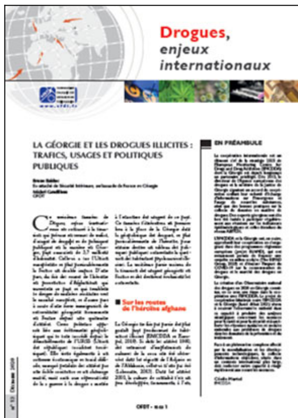
Drogues, enjeux internationaux n° 13, OFDT, 9 p. Décembre 2020

La publication de l'OFDT Drogues, enjeux internationaux , centrée sur les questions de l'offre internationale en matière de substances illicites consacre son 13 e numéro à la Géorgie, pays caucasien de 3,7 millions d'habitants. Il évoque d'abord la question des routes de l'héroïne. Située au carrefour de deux axes d'acheminement de l'héroïne afghane à destination de la Russie et de l'Union européenne (route du Caucase et route du Nord) et à proximité de la route dite des Balkans, la Géorgie subit depuis quelques années une intensification de l'activité des trafics qui la rend vulnérable aux activités du crime organisé. Alors qu'il a développé à partir du milieu des années 2000 une politique de lutte contre les drogues particulièrement sévère, le pays est également confronté à des enjeux sanitaires importants dont témoignent les prévalences élevées des virus du VHC et du VIH chez les consommateurs de drogues illicites. C'est d'ailleurs dans le contexte de guerre à la drogue qu'on a pu noter une certaine affluence en France d'usagers particulièrement précarisés originaires de Géorgie à partir de 2004-2005.