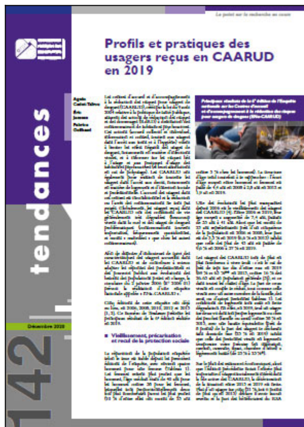
Tendances n° 142, OFDT, 4 p. Décembre 2020

La sixième édition de l'enquête nationale auprès des usagers des CAARUD, ENa-CAARUD mise en place par l'OFDT en 2006, s'est déroulée en 2019. Les principales conclusions sont présentées dans le numéro 142 de Tendances. Elles permettent de décrire les évolutions de la population observée, de ses usages et des comportements à risque. Le vieillissement des usagers des CAARUD est constant depuis la première enquête : ils ont désormais 41 ans en moyenne contre 33 ans en 2006. L'enquête souligne également la détérioration de leurs conditions de vie et leur précarisation. Concernant les substances les plus souvent consommées, l'édition 2019 témoigne de la place importante des usages de cocaïne et de la progression de la cocaïne basée. S'agissant des pratiques d'injection, l'enquête fait apparaître de fortes disparités générationnelles : si 62 % des moins de 25 ans n'ont jamais pratiqué l'injection, 52 % des plus de 35 ans signalent une injection récente et dans certains cas on note des primo injections tardives. Par ailleurs, après le recul observé entre 2012 et 2015, les résultats de l'enquête montrent le retour à une évolution positive de la proportion de la pratique de dépistage du VIH et du VHC chez les usagers des CAARUD, surtout les plus âgés.