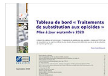
Tableau de bord « Traitements de substitution aux opioïdes » 2020