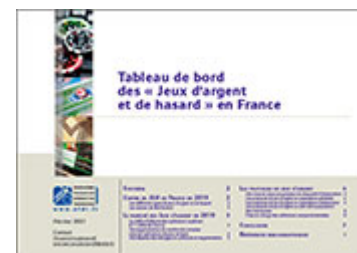
Tableau de bord des « Jeux d'argent et de hasard » en France - données 2019