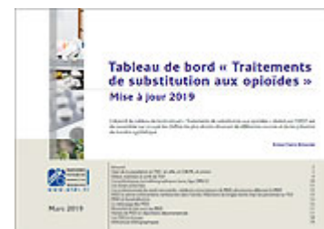
Tableau de bord « Traitements de substitution aux opioïdes » 2019