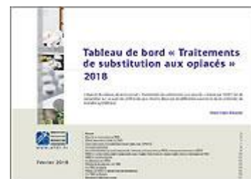
Tableau de bord « Traitements de substitution aux opioïdes » 2018