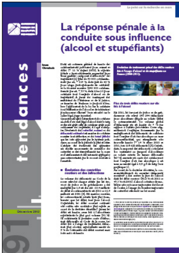
Tendances n° 91, OFDT, 6 p. Décembre 2013

Quelque quarante ans après l'interdiction de conduire au delà d'un seuil légal d'alcool dans le sang et dix ans après celle de tout usage de stupéfiants au volant, ce numéro 91 de Tendances se propose d'analyser l'application de la loi dans ce domaine, en se centrant particulièrement sur la dernière décennie.