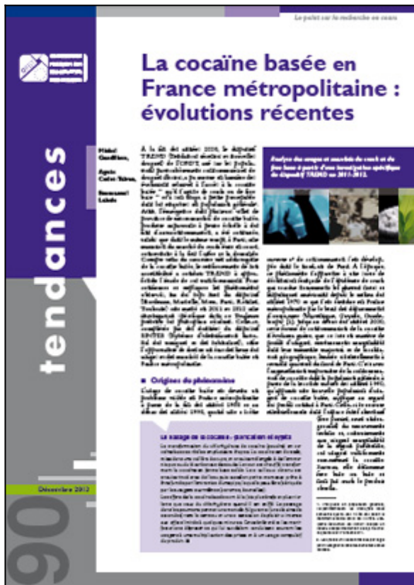
Tendances n° 90, OFDT, 4 p. Décembre 2013

Établi à partir d'une investigation spécifique du dispositif Tendances récentes et nouvelles drogues (TREND), ce numéro de Tendances, dresse un état des lieux des usages et des marchés de la cocaïne basée en France, que le produit circule sous le nom de crack ou sous celui de free base.