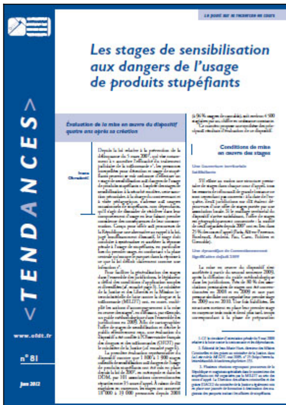
Tendances n° 81, OFDT, 6 p. Juin 2012

Depuis 2007, les personnes interpellées pour détention et usage de stupéfiants peuvent se voir ordonner d'effectuer un « stage de sensibilisation aux dangers de l'usage de produits stupéfiants ». Cette sanction pécuniaire, à la charge du contrevenant et à visée pédagogique, s'adresse aux usagers occasionnels de stupéfiants, non dépendants, qu'il s'agit de dissuader de récidiver dans leur comportement d'usage en leur faisant prendre conscience des conséquences de leur consommation. Conçu pour offrir aux procureurs de la République une alternative au rappel à la loi, jugé insuffisamment dissuasif, le stage doit conduire à systématiser et accélérer la réponse pénale à l'usage de stupéfiants, en particulier lors du premier usage.