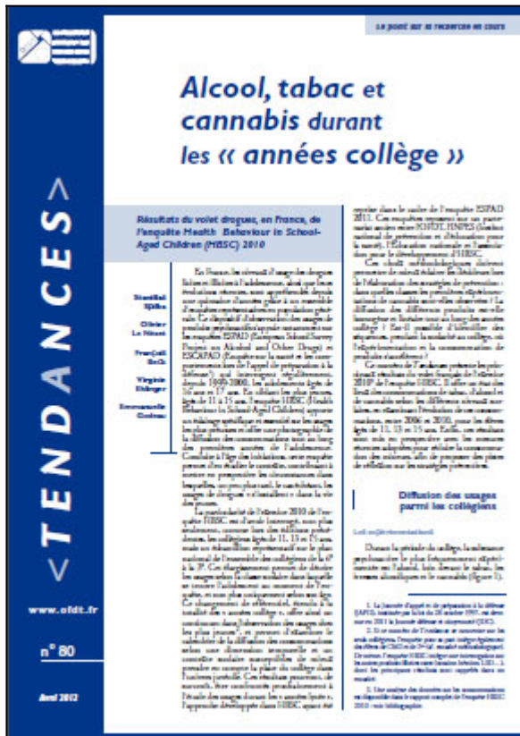
Tendances n° 80, OFDT, 6 p. Avril 2012

Le numéro 80 de Tendances présente les résultats du volet drogues de l'enquête HBSC (Health Behaviour in School-Aged Children ) en France en 2010.