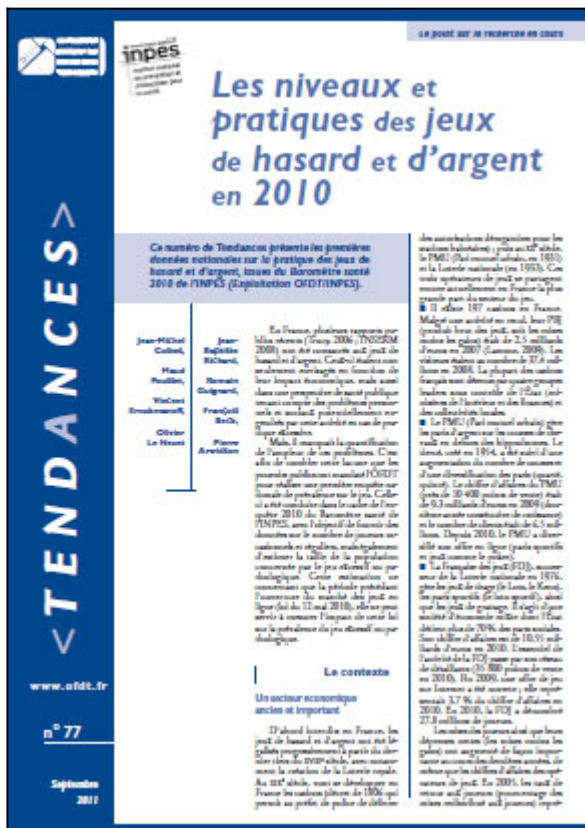
Tendances n° 77, OFDT, 8 p. Septembre 2011

En France, plusieurs rapports publics récents (Trucy, 2006 ; INSERM 2008) ont été consacrés aux jeux de hasard et d'argent. Ceux-ci étaient non seulement envisagés en fonction de leur impact économique, mais aussi dans une perspective de santé publique tenant compte des problèmes personnels et sociaux potentiellement engendrés par cette activité en cas de pratique excessive. Mais, il manquait la quantification de l'ampleur de ces problèmes. C'est afin de combler cette lacune que les pouvoirs publics ont mandaté l'OFDT pour réaliser une première enquête nationale de prévalence sur le jeu. Celle-ci a été conduite dans le cadre de l'enquête 2010 du Baromètre santé de l'INPES, avec l'objectif de fournir des données sur le nombre de joueurs occasionnels et réguliers, mais également d'estimer la taille de la population concernée par le jeu excessif ou pathologique. Cette estimation ne concernant que la période précédant l'ouverture du marché des jeux en ligne (loi du 12 mai 2010), elle ne peut servir à mesurer l'impact de cette loi sur la prévalence du jeu excessif ou pathologique.