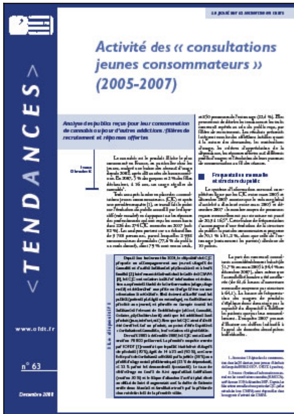
Tendances n° 63, OFDT, 4 p. Décembre 2008

Le cannabis est le produit illicite le plus consommé en France, en particulier chez les jeunes, malgré une baisse des niveaux d'usage depuis 2002, après dix années de hausse continue. En 2007, 5% des garçons et 2% des filles déclaraient, à 16 ans, un usage régulier de cannabis.