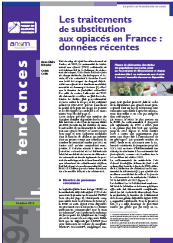
Tendances n° 94, OFDT, 6 p. Octobre 2014

Près de vingt ans après leur introduction en France, en 1995, les traitements de substitution aux opiacés (TSO) constituent un des fondements de la politique de réduction des risques. Le dernier plan gouvernemental de lutte contre la drogue et les conduites addictives 2013-2017 prévoit d'améliorer la qualité de la prise en charge des patients et de développer l'accessibilité à ces traitements.