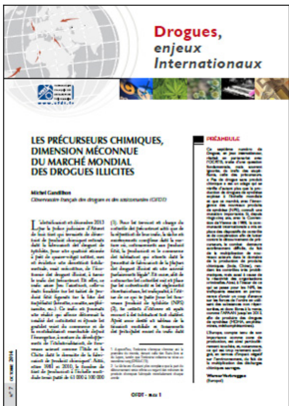
Drogues, enjeux internationaux n° 7, OFDT, 8 p. Octobre 2014

Le septième numéro de Drogues, enjeux internationaux , réalisé en partenariat avec l'Office central de répression du trafic illicite des stupéfiants (OCTIS), se penche sur une question souvent méconnue : le trafic des précurseurs chimiques. Ces substances chimiques, psychoactives ou non, sont indispensables à la préparation (extraction ou surtout synthèse) des stupéfiants. Pour les services en charge du contrôle des précurseurs ainsi que de la répression de leur trafic, la tâche est extrêmement complexe dans la mesure où la production et le commerce des substances entrant dans la fabrication de la plupart des drogues illicites est une activité légale. En outre, afin de contourner les contrôles mis en place par les conventions et les règlements internationaux, les trafiquants, à l'instar de ce qui se passe pour les nouveaux produits de synthèse (NPS), ne cessent d'innover en ayant recours à des substances non classées.