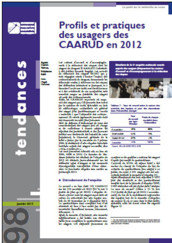
Tendances n° 98, OFDT, 8 p. Janvier 2015

Les centres d'accueil et d'accompagnement à la réduction des risques chez les usagers de drogues (CAARUD) reçoivent en majorité des usagers qui, s'ils peuvent être suivis par le système de soins, spécialisé ou non en addictologie, connaissent en général des usages plus problématiques et moins « maîtrisés » que l'ensemble des consommateurs, et vivent souvent dans des situations sociales plus précaires.