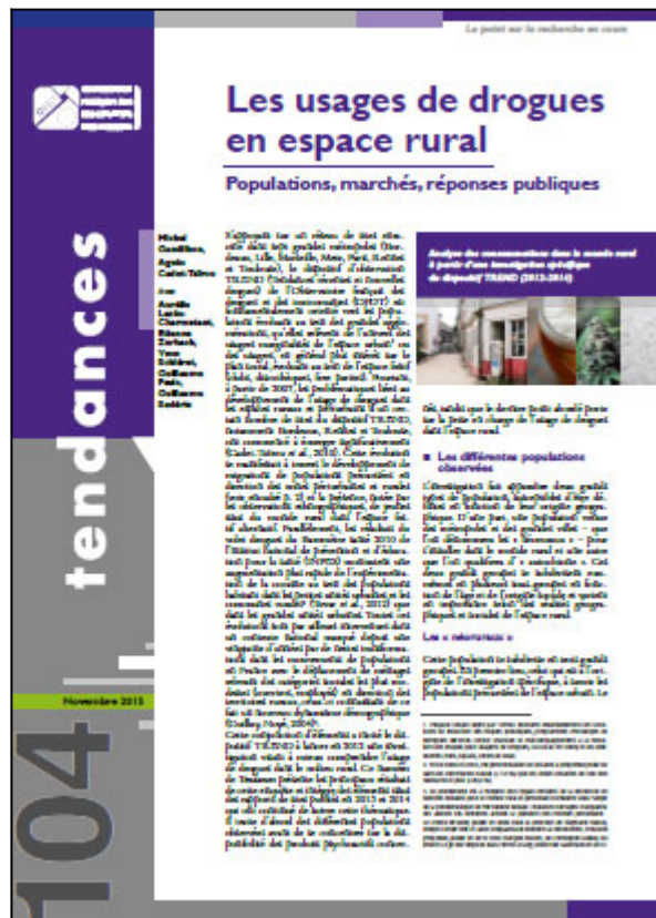
Tendances n° 104, OFDT, 4 p. Novembre 2015

Le dispositif Tendances récentes et nouvelles drogues (TREND) de l'OFDT s'est penché entre 2012 et 2014 sur les problématiques liées au développement de l'usage de drogues dans les espaces ruraux. Résolument centrées sur les espaces urbain et festif, les observations de TREND avaient en effet progressivement mis en lumière plusieurs phénomènes convergents concernant des migrations de populations consommatrices vers des zones périurbaines et rurales et l'apparition de jeunes issus du monde rural dans les espaces festifs alternatifs.