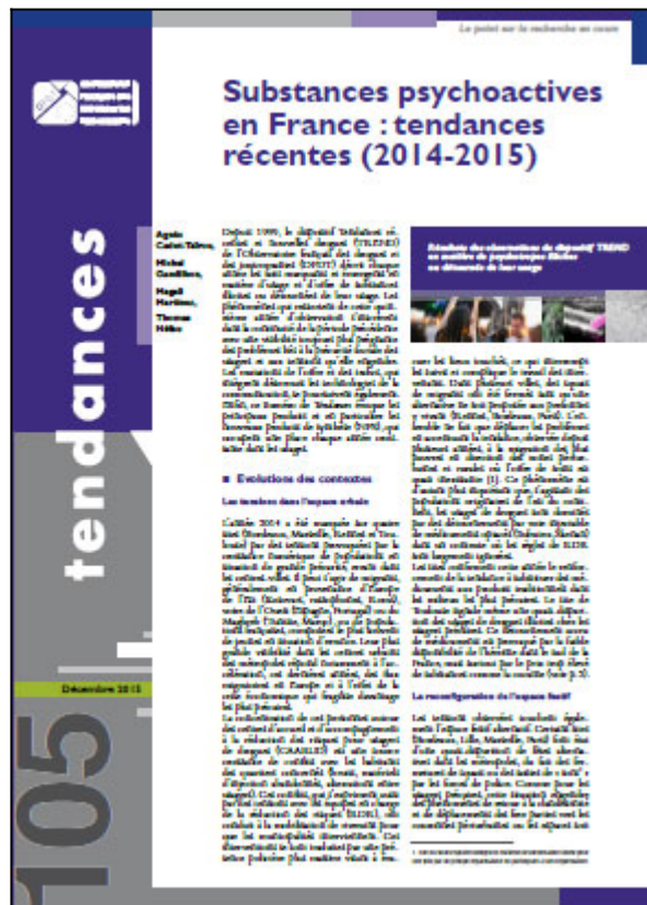
Tendances n° 105, OFDT, 6 p. Décembre 2015