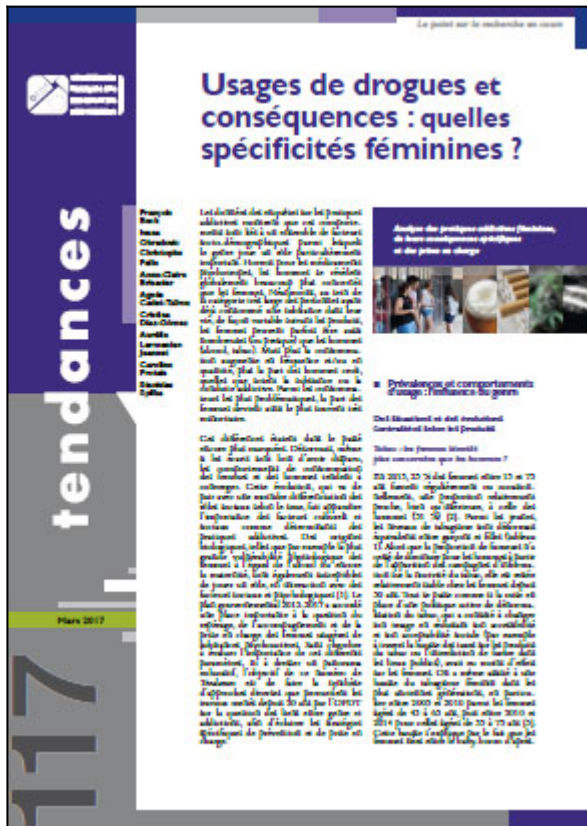
Tendances n° 117, OFDT, 8 p. Mars 2017

Les hommes et les femmes sont-ils autant consommateurs de substances psychoactives ? La réponse à cette question globale est assurément négative. En France, comme partout ailleurs, les hommes consomment plus de drogues licites ou illicites et ce d'autant plus qu'il s'agit d'un usage intensif en quantité et en fréquence. Ce constat général demande néanmoins à être nuancé car, parmi les récentes évolutions observées, celle d'un rapprochement progressif des niveaux de consommation masculins et féminins est souvent soulignée. Longtemps moins concernées par les usages de drogues, les femmes auraient tendance à adopter des comportements plus proches de ceux des hommes et donc à consommer davantage.