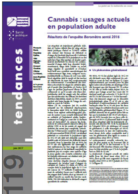
Tendances n° 119, OFDT, 4 p. Juin 2017

Mené en 2016 auprès d'un échantillon représentatif de la population de 15-75 ans, le Baromètre santé 2016 de Santé publique France permet notamment d'actualiser les données relatives au cannabis. Cette mise à jour apparaît d'autant plus pertinente qu'il s'agit du produit psychoactif illicite le plus consommé et que les dernières données disponibles, datant de 2014, avaient montré une nette hausse de l'usage de cannabis au cours de l'année chez les adultes.