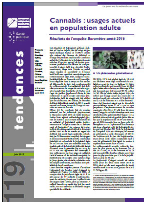
Tendances n° 119, OFDT, 4 p. Juin 2017

Mené en 2016 auprès d'un échantillon représentatif de la population de 15-75 ans, le Baromètre santé 2016 de Santé publique France permet notamment d'actualiser les données relatives au cannabis. Cette mise à jour apparaît d'autant plus pertinente qu'il s'agit du produit psychoactif illicite le plus consommé et que les dernières données disponibles, datant de 2014, avaient montré une nette hausse de l'usage de cannabis au cours de l'année chez les adultes.