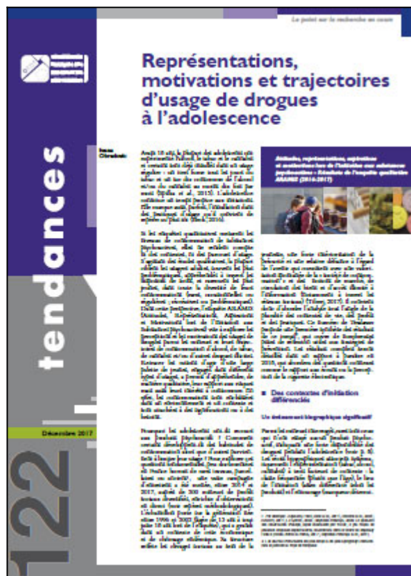
Tendances n° 122, OFDT, 8 p. Décembre 2017

Afin de mieux connaître les motivations des plus jeunes à essayer et à consommer des substances psychoactives, l'OFDT a mené entre 2014 et 2017 une vaste enquête qualitative. ARAMIS (Attitudes, Représentations, Aspirations et Motivations lors de l'Initiation aux Substances psychoactives) visait à explorer les perceptions des usages de drogues (principalement d'alcool, de tabac, de cannabis) de jeunes gens mineurs tout en retraçant leurs trajectoires de consommation. Au total, 200 jeunes issus de milieux sociaux diversifiés en France métropolitaine et âgés de 13 ans à tout juste 18 ans (16,2 ans en moyenne) ont été interrogés dans le cadre de cette recherche. Les premiers résultats d'ARAMIS font l'objet du numéro 122 de Tendances.