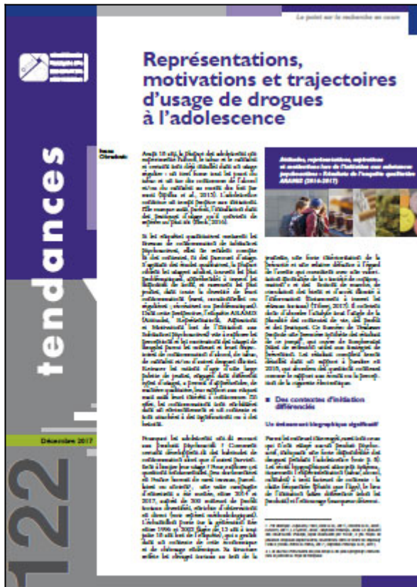
Tendances n° 122, OFDT, 8 p. Décembre 2017

Afin de mieux connaître les motivations des plus jeunes à essayer et à consommer des substances psychoactives, l'OFDT a mené entre 2014 et 2017 une vaste enquête qualitative. ARAMIS (Attitudes, Représentations, Aspirations et Motivations lors de l'Initiation aux Substances psychoactives) visait à explorer les perceptions des usages de drogues (principalement d'alcool, de tabac, de cannabis) de jeunes gens mineurs tout en retraçant leurs trajectoires de consommation. Au total, 200 jeunes issus de milieux sociaux diversifiés en France métropolitaine et âgés de 13 ans à tout juste 18 ans (16,2 ans en moyenne) ont été interrogés dans le cadre de cette recherche. Les premiers résultats d'ARAMIS font l'objet du numéro 122 de Tendances, rédigé par Ivana Obradovic.