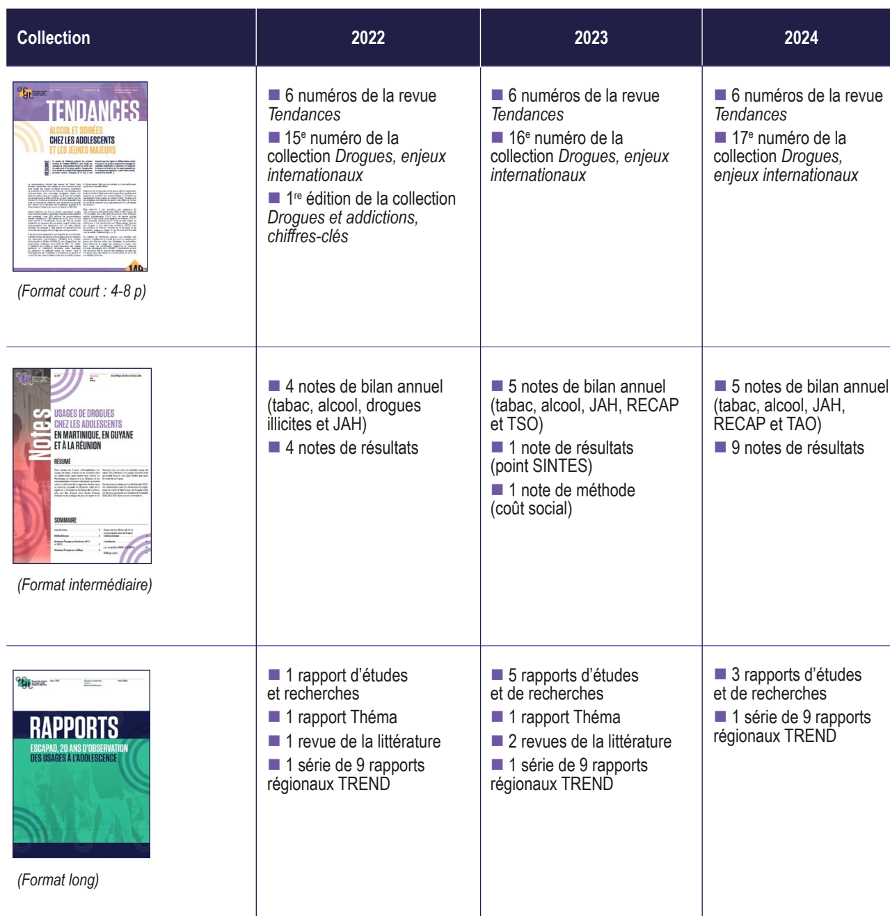
Tableau 2. Répartition des publications par année et par collection